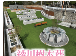
綾川樹木葬 香川県綾歌郡綾川町北 1103 番地 1