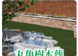
丸亀樹木葬 香川県丸亀市南条町 16