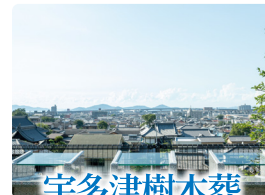
宇多津樹木葬 香川県綾歌郡宇多津町 1263